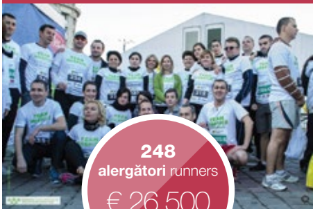
Semimaratonul București Bucharest Half Marathon

participates every year in the Bucharest Half Marathon , in May, and in the Bucharest Marathon , in October. Team HOSPICE is the largest and most visible team in these two competitions. Fundraising is done by runners and companies who support them.