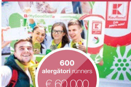
Maratonul București Bucharest Marathon